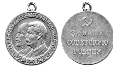
Медаль «Партизану Отечественной войны».

В августе 1943 года все отделы Думиничского РИК и РК