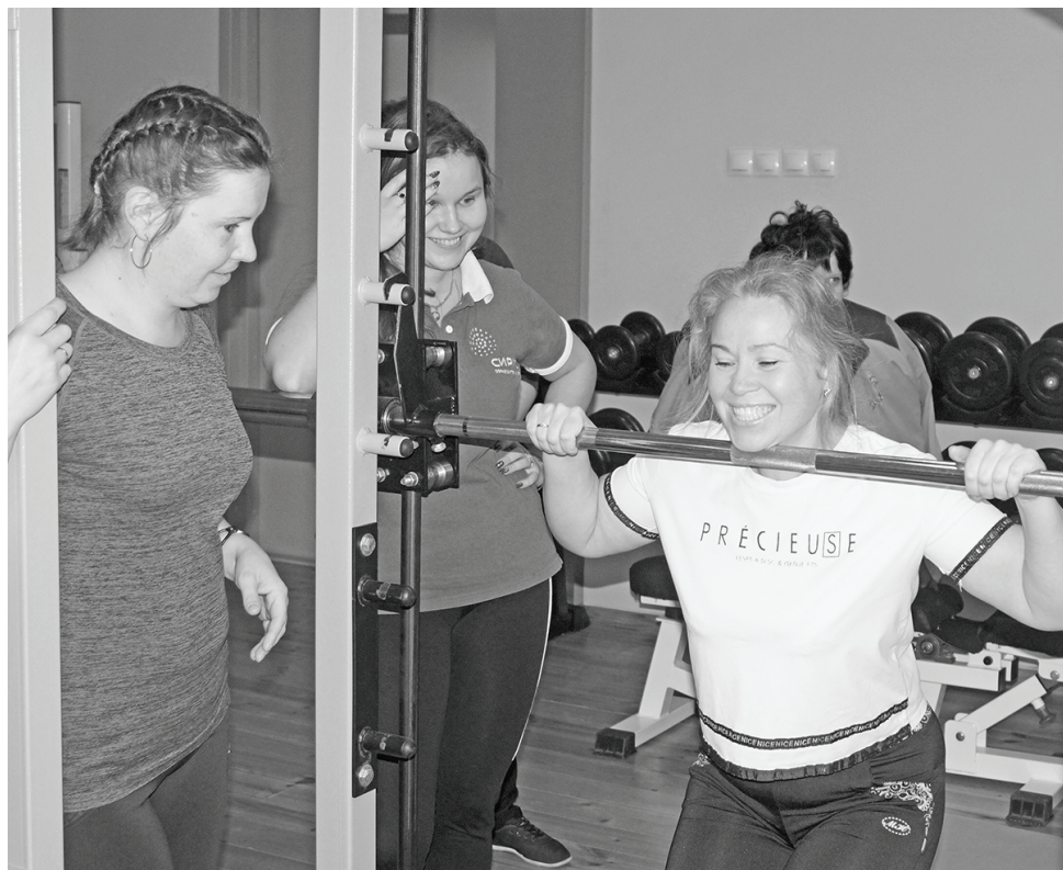
Спорт - это праздник!